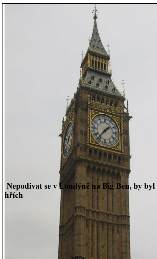
Nepodívat se v Londýně na Big Ben, by byl hřích

Čas od času jsem se pokusila usnout, ale marně. V autobuse, kde nebylo moc místa ani na nohy, se příliš dobře nespalo. Několikahodinové sezení mi připadalo náročné,