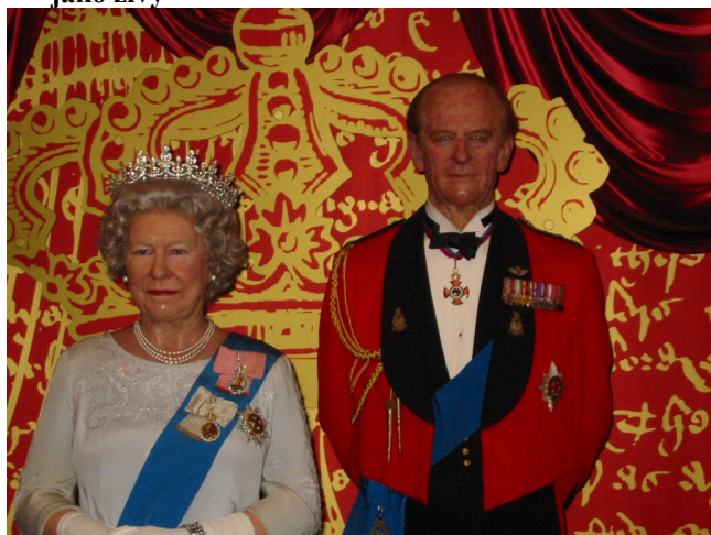
Královský pár v muzeu voskových figurín vypadá jako živý

Poslední den jsme se jeli podívat do městečka Maidenhead, odkud nás loď po Temži zavezla do Windsoru. Hrad Windsor Castle byl opravdu nádherný. Po krátkém rozchodu jsme jeli do Legolandu. Zde jsme viděli miniatury mnoha světových staveb, postavených z lega a spoustu jiných atrakcí. Počasí nás však opět zklamalo, protože celou dobu pršelo a bylo celkem chladno.